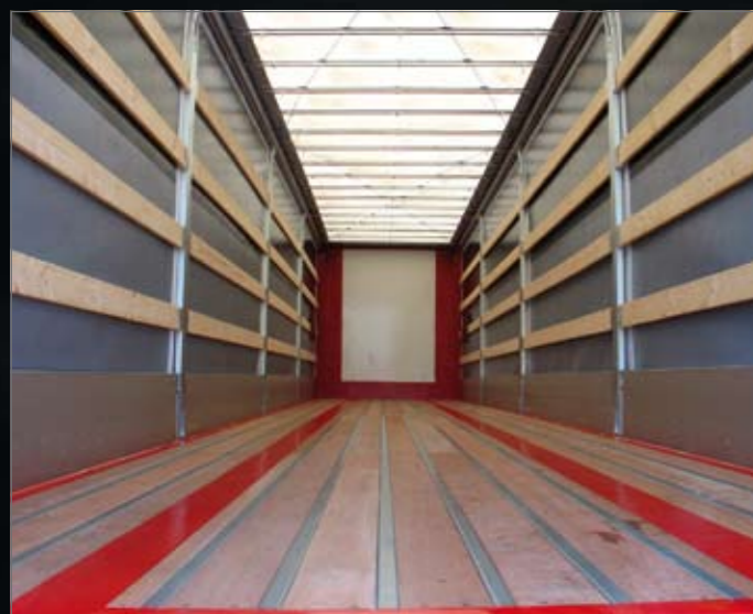
Hardhouten vloer met stalen omega's en staalkabels tegen het dak.