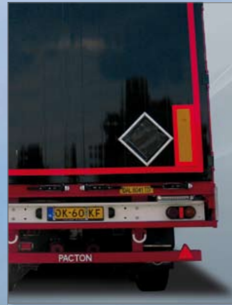
Standaard uitvoering met anti-vacuüm-ventielen en vangkabels.