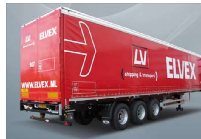
Ondergebouwde bumper met 2 ferry-ogen.