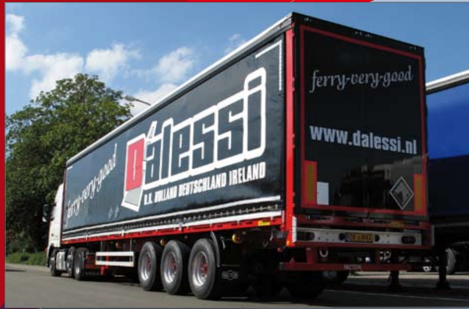
Retro-reflecterende strepen op de zeilen.