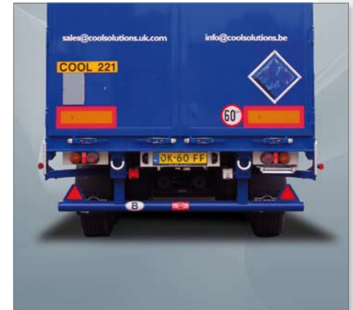
Achterkant met Rubbolite achterlampen en ronde bumper.