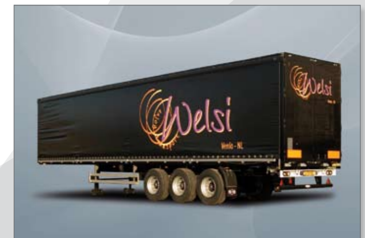
Uitvoering met 2 x 3 rongen en 2 x 4 zijborden.