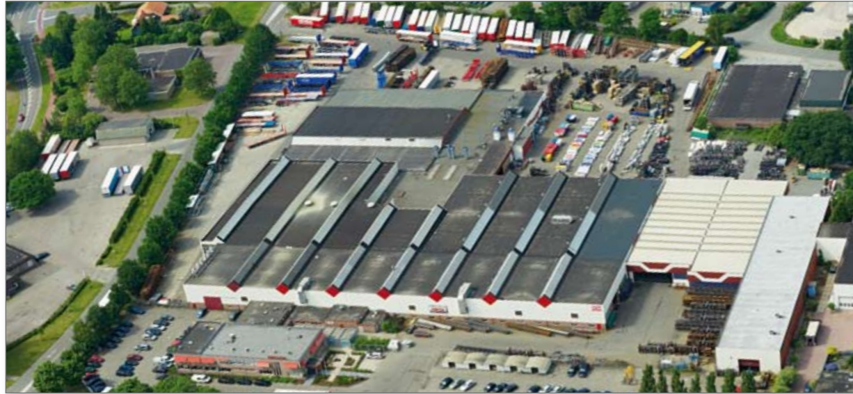
Pacton hoofdvestiging te Ommen