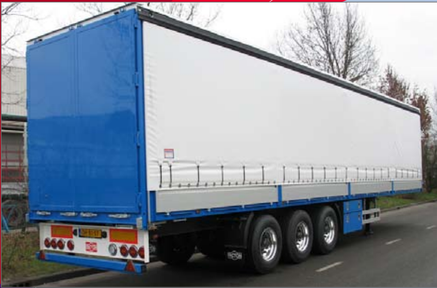
Dubbele kist, extra hoge lichtbak