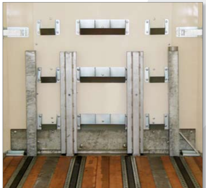
Aanpassing ten behoeve van vervoer van papierrollen