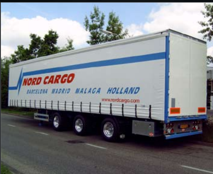
Voorste en achterste as gestuurd