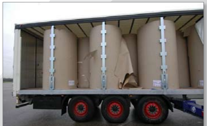
Papierrollen staand te vervoeren zonder spanbanden