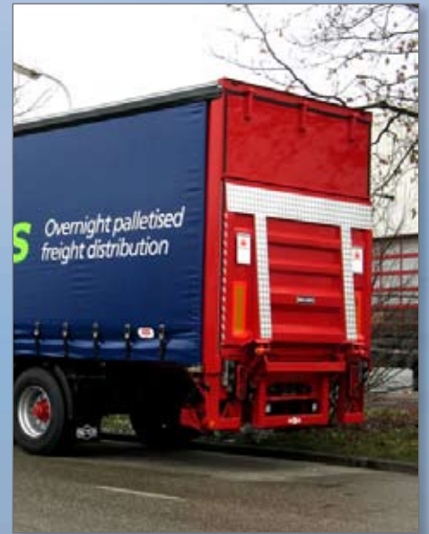
Uitgevoerd met achtersluitende laadklep