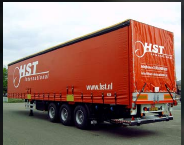
Huckepack uitvoering met onderschuiflaadklep