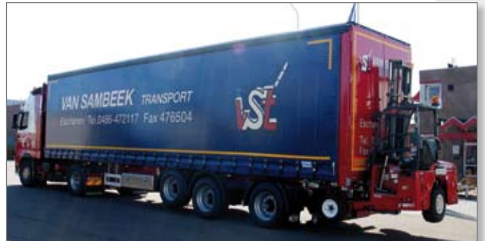
Voorste as hefbaar, achterste as gestuurd, meeneemheftruck